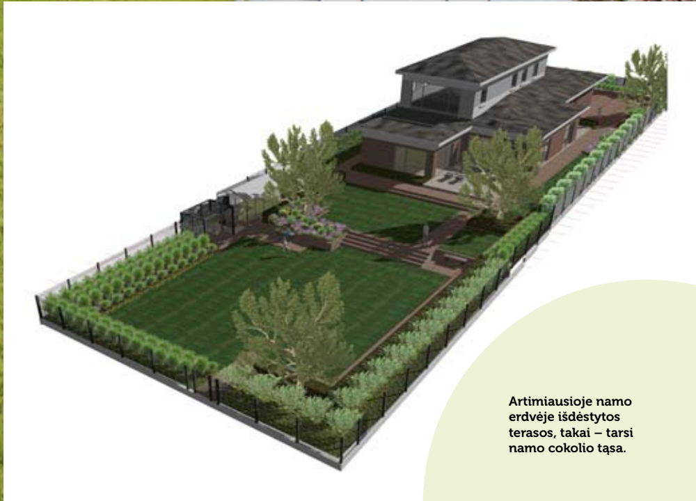
Artimiausioje namo erdvėje išdėstytos terasos, takai – tarsi namo cokolio šaša.